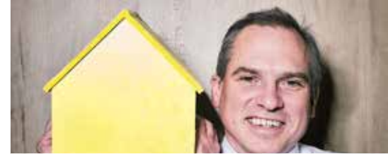
Hervorming sociale woningmarkt (p.3)