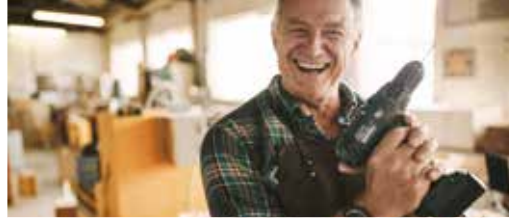
De arbeidsmarkt in Ronse trekt aan (p. 2)