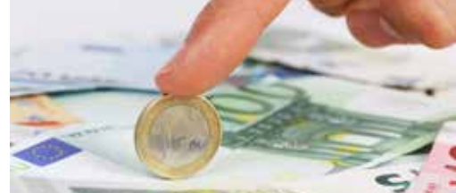
Vlaanderen investeert in Ronse p. 3