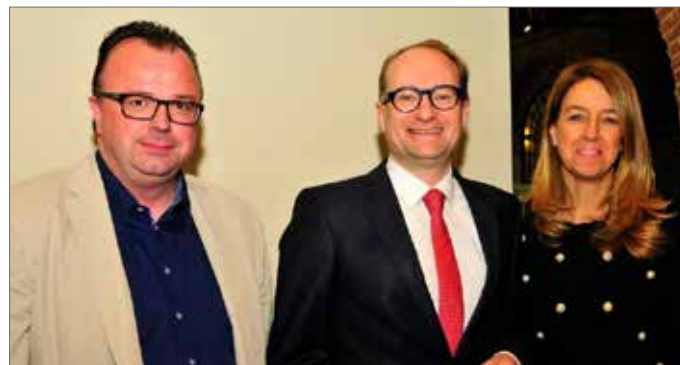
▲ Vlaams minister Ben Weyts draagt Ronse een warm hart toe.

We plukken ook in Ronse de vruchten van het Vlaamse investeringsbeleid. Dankzij de ondersteuning van de Vlaamse ministers Ben Weyts en Philippe Muylers werken we verder aan een aantrekkelijk en ondernemend Ronse.