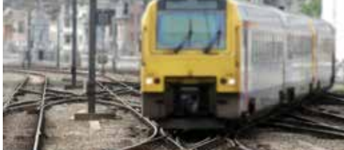
Ronse krijgt betere treinverbinding p. 2