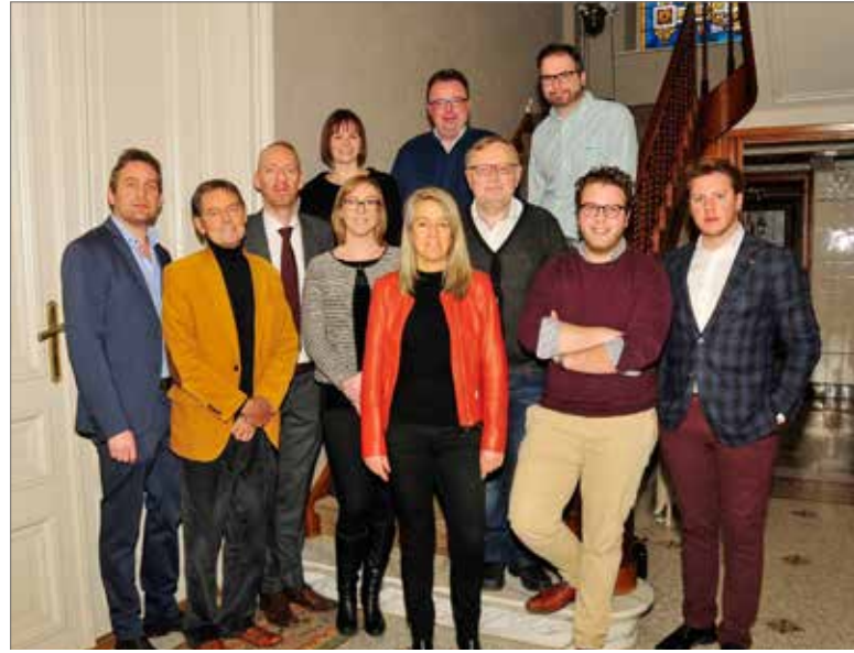
▲ Tijdens de vierde ‘Op de koffie met ...’ werden de pijnpunten en de toekomstige uitdagingen van het onderwijs in Ronse toegelicht.

Ten slotte ziet het ernaar uit dat het stijgend aantal leerlingen in het lager onderwijs vanaf 2020 een uitdaging vormt voor de se-