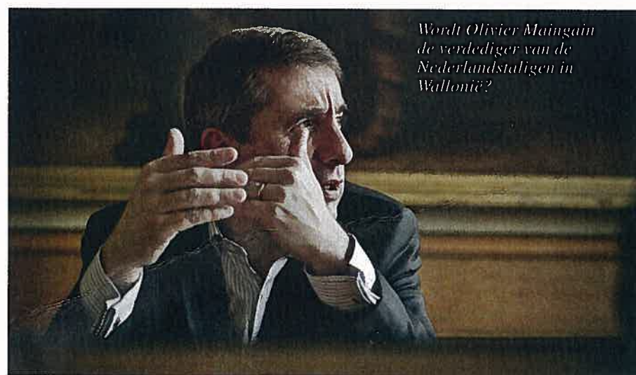
Wordt Olivier Maingain de verdediger van de Nederlandstaligen in Wallonië?